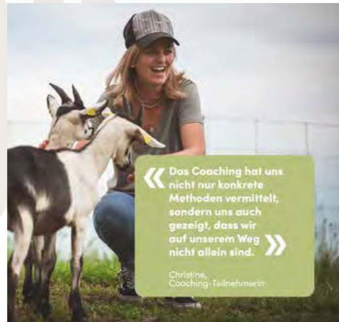
Wissensvermittlung und Austausch...

« Das Coaching hat uns nicht nur konkrete Methoden vermittelt, sondern uns auch gezeigt, dass wir auf unserem Weg nicht allein sind. »