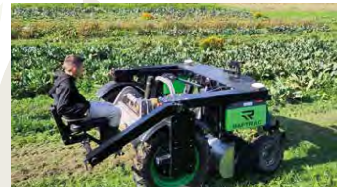
Vorführung des Raptracs bei Plankton

Bern, Basel, Luzern und Zürich bespielt wurde. Für die Eröffnung konnten Parlamentarier:innen aus vier verschiedenen Parteien (SVP, Mitte, SP, Grüne) sowie Persönlichkeiten aus der Praxis und Zivilgesellschaft gewonnen werden. Rund 150 Teilnehmende setzten sich in dem interaktiven Setting mit globalen Zusammenhängen von Hunger, Klima, Ressourcen und Gerechtigkeit auseinander.