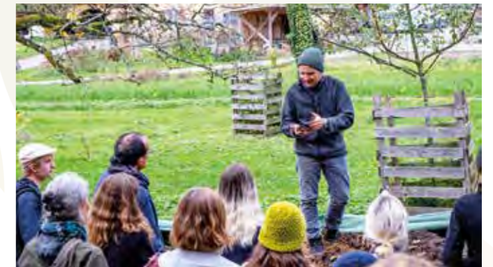
Führung auf dem Hof Falbringen