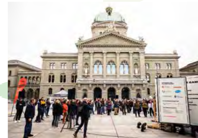
«Escape Hunger» auf dem Bundesplatz zum Welternährungstag

Ergänzend engagierte sich Agroecology Works! in Kooperation mit der Sufosec-Allianz 2025 erstmals für die Sichtbarmachung des Internationalen Welt-ernährungstages in der Schweiz.