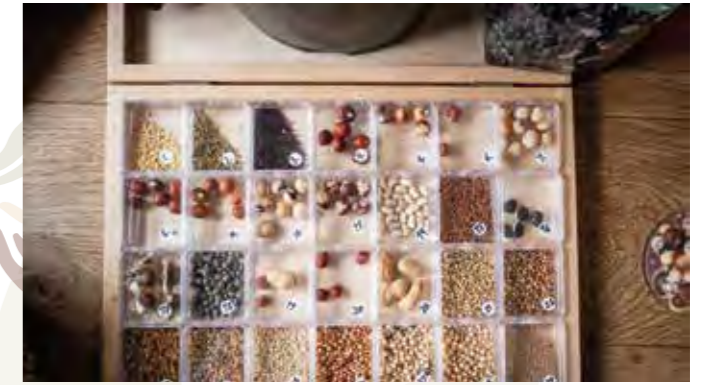
Bio Leguminosentag bei New Roots

Kernstück des Welternährungstags war das mobile Escape Game «Escape Hunger – Raus aus der Hungerkrise», das im Oktober 2025 auf dem Bundesplatz in Bern eröffnet und anschliessend in