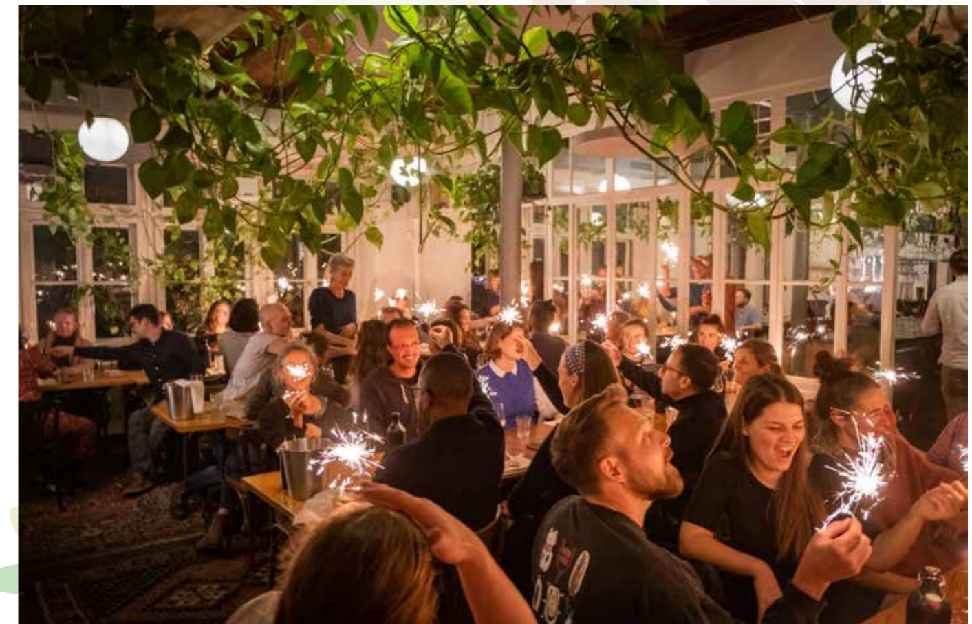
Feiern an der Abschlussveranstaltung: 5 Jahre «Tage der Agrarökologie»